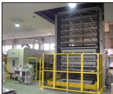
ガトリングプレス(GT3300)