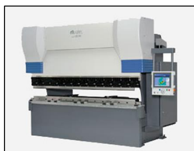
ベンダー(プレスブレーキ・BH13530)