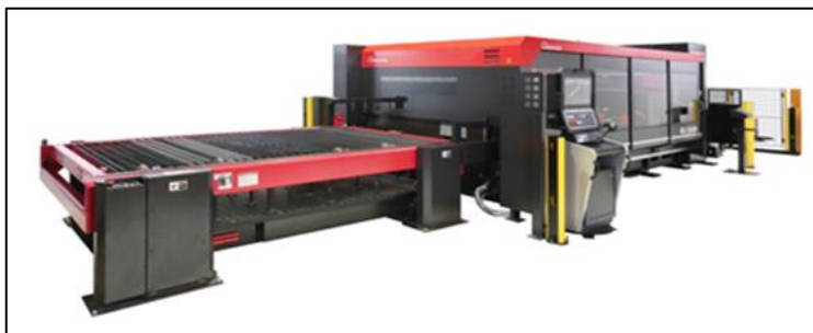
フライング光学レーザー加工機(FOM II RI3015)