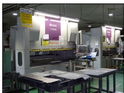
ベンダー(プレスブレーキ・F-125-25)