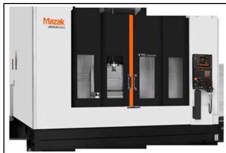
マシニングセンタ(VTC-530/20)